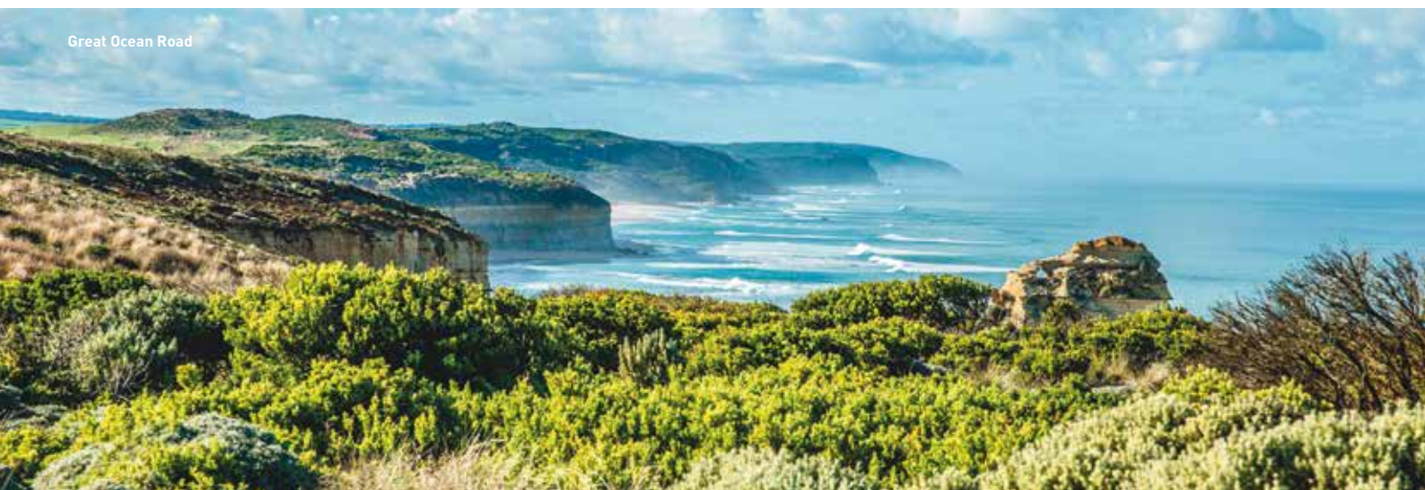
Great Ocean Road

8 06.09.21 Sydney – Ausflug in den Ku-ring-Gai Nationalpark: Sie fahren in Richtung Norden und über die Hafenbrücke nach Akuna Bay. Dort angekommen gehen Sie zunächst an Bord einer Yacht und unternehmen eine wunderschöne Fahrt durch die unberührte Natur des Nationalparks, auf dem Hawkesbury River. Per Bus geht es im Anschluss weiter zu einer Lichtung, wo Sie einige der über 1.500 Felszeichnungen der Ureinwohner bestaunen können. Erklärung der dort ansässigen Pflanzen und deren Nutzung durch die Ureinwohner. Ausgiebiges Mittagessen (Känguru Sandwich, Aussie Beef Burger, Früchte). Anschließend Fahrt zum West Head Lookout, wo ein fantastischer Blick über die Flusslandschaft und den Pazifik auf Sie wartet. Rückkehr zum Hotel und Rest des Tages zur freien Verfügung. Übernachtung: Travelodge Wynyard